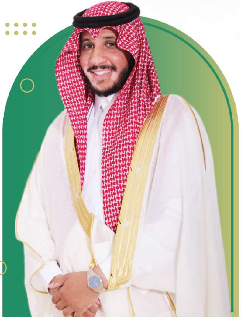
سعادة الدكتور حامد بن عسكر العضيله